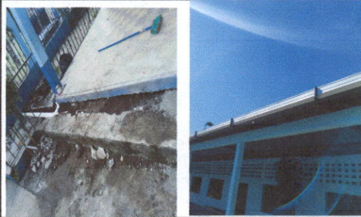
FOTO 7: Sustitución de canal de metal en modulo de aula 5 6 7 8 9 10 y 11 Y sustitucion de tubo 3